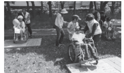
福祉フェアの一場面 ～ボランティアの皆さんとともに～