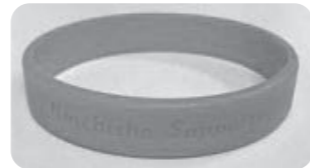
認知症サポーターのオレンジリング (受講者には差し上げます)

問合せ・申込み先 播磨町地域包括支援センター 電話 079-435-1841 播磨町南大中1-8-41 播磨町福祉しあわせセンター内