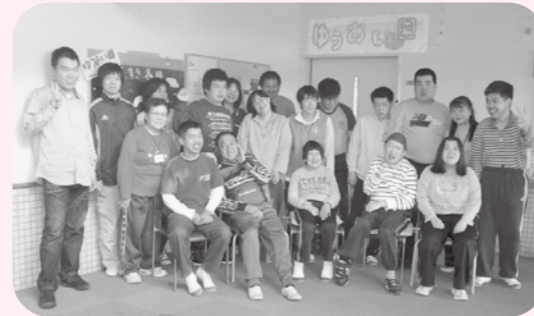
「よろしくお願いします」

就労継続支援B事業所というのは、障害者自立支援法により実施される障害福祉サービス事業の中の1つの種類です。障害のある利用者の方が、一般就労を目指して、生産活動や日常生活・社会生活のための訓練を行っています。