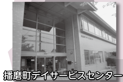
播磨町デイサービスセンター

高齢者給食サービス 介護機器の貸出事業 移送事業 介護保険事業 ・障害者通所施設の運営 寝具乾燥消毒サービス 等々・・・