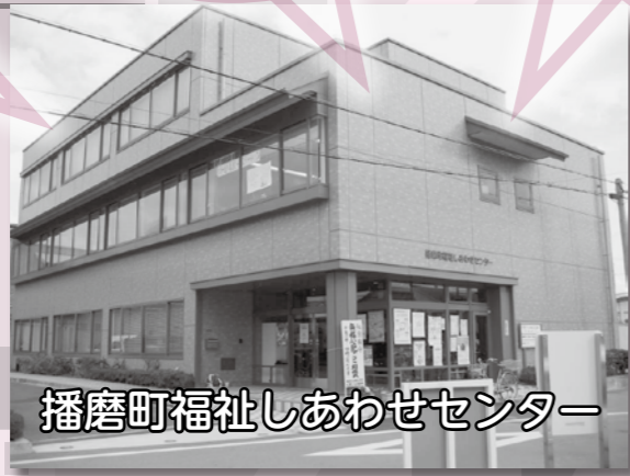
播磨町福祉しあわせセンター