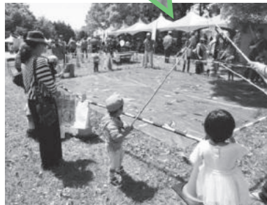
昔の遊びコーナー