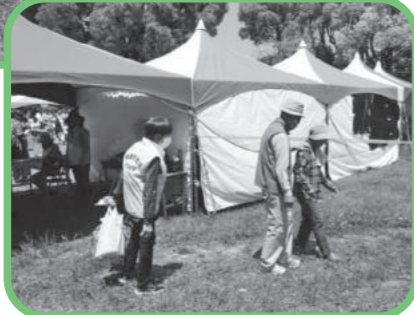
ガイドヘルプ体験