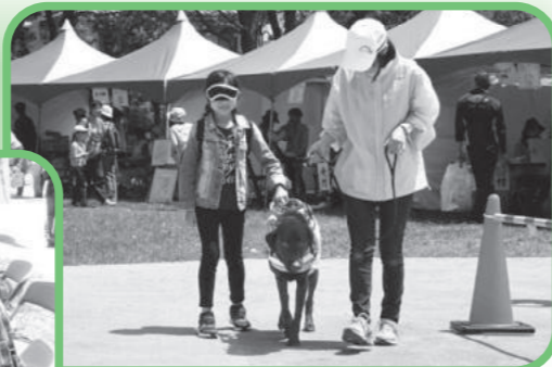
盲導犬のデモンストレーション